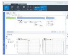
OpenLab CDS 2.7