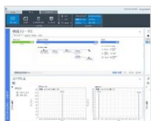
OpenLab CDS 2.2