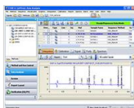
OpenLab CDS ChemStation Edition