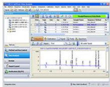
OpenLab CDS ChemStation Edition C.01.07