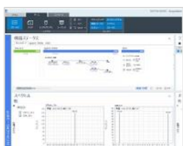
OpenLab CDS 2 WorkStation / WorkStation Plus